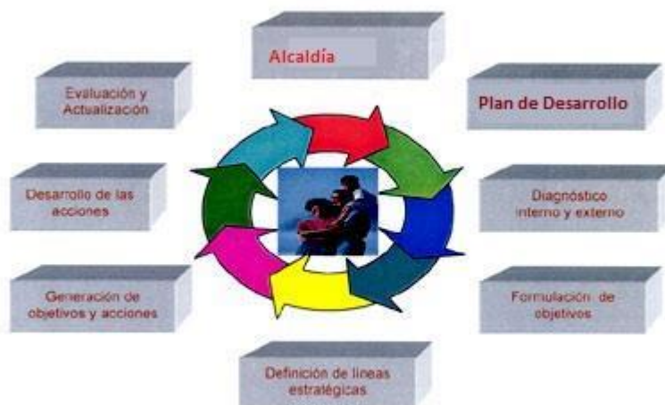
Figura 1. Planeación estrategia del entorno

Sin ahondar más en este tema, puesto que se analizará en el avance del proyecto, lo que busca el Plan Estratégico de Tecnologías de Información es romper ese círculo vicioso de compras no planeadas, de fortalecer y basar los servicios en sistemas de información optimizando los tiempos de respuesta y demás ventajas descritas en la implementación de este documento.