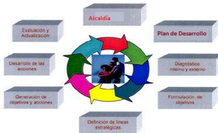
Figura 1. Planeación estrategia del entorno

Sin ahondar más en este tema, puesto que se analizará en el avance del proyecto, lo que busca el Plan Estratégico de Tecnologías de Información es romper ese círculo vicioso de compras no planeadas, de fortalecer y basar los servicios en sistemas de información optimizando los tiempos de respuesta y demás ventajas descritas en la implementación de este documento.